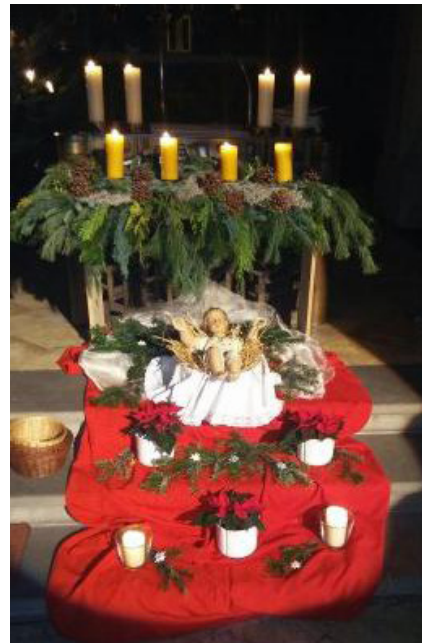
Bild: Jesuskind aus der Pfarrkirche St. Michael 2019

Der Pfarrgemeinderat Schwanfeld würde sich freuen, wenn auch im Jahr 2021 diese schöne Tradition in der Adventszeit statt finden, und Tag für Tag wieder ein neues Fenster in unserem Ort erstrahlen kann.