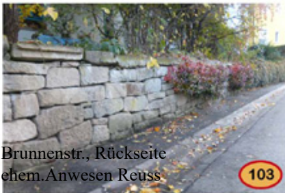
Brunnenstr., Rückseite ehem. Anwesen Reuss