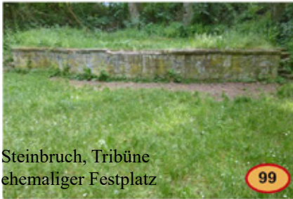
Steinbruch, Tribüne ehemaliger Festplatz