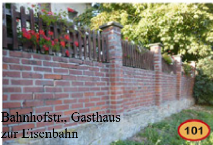
Bahnhofstr., Gasthaus zur Eisenbahn